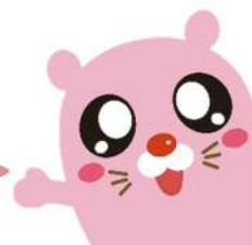
さぽーとほっと基金公式キャラクター キャッピー

市民の皆さんの寄付をもとに、札幌市のまちづくり活動を応援する「さぽーとほっと基金」の助成事業を募集します。 保健、医療、福祉の増進や文化・スポーツ・観光・経済等の振興、子どもの健全育成など、様々な分野の活動を助成します。