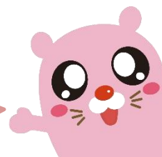
さぽーとほっと基金公式キャラクター キャッピー

市民の皆さんの寄付をもとに、札幌市のまちづくり活動を応援する「さぽーとほっと基金」の助成事業を募集します。 保健、医療、福祉の増進や文化・スポーツ・観光・経済等の振興、子どもの健全育成など、様々な分野の活動を助成します。