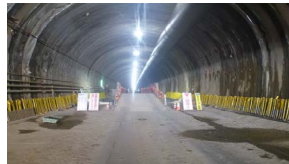
21.内浦トンネル(東川) 本坑状況