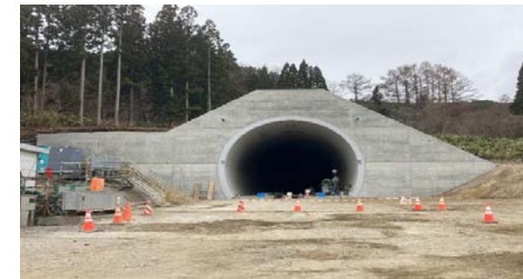
19.国縫トンネル他 坑内状況