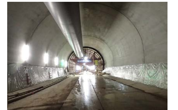
33.後志トンネル(塩谷) 切羽状況