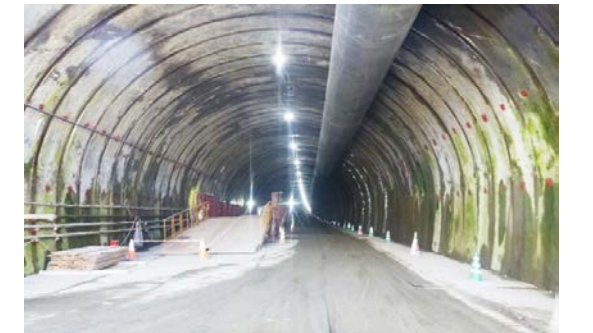
21.内浦トンネル(東川) 本坑状況