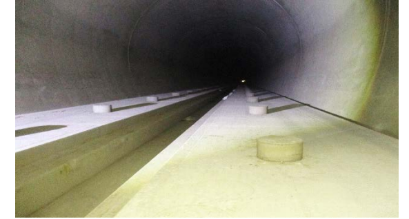
19.国縫トンネル他 坑内状況