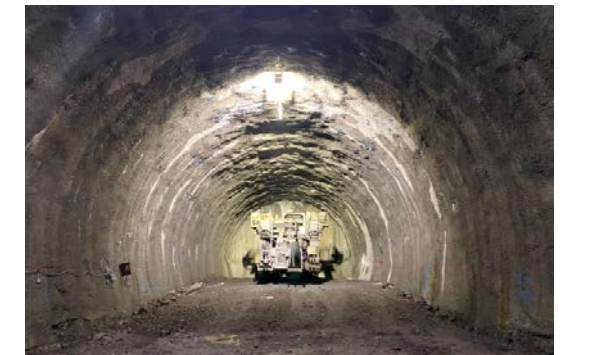
28.ニツ森トンネル(鹿子)他 覆工完了状況