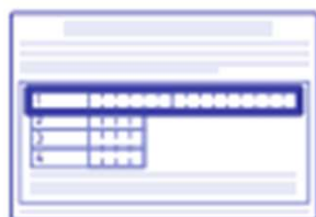
署名用電子証明書 暗証番号 (本人確認(電子署名) のため)