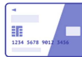
クレジットカード