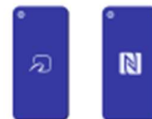
スマートフォン (アプリのインストール)