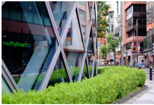
公道に面する敷地内地上部の緑化