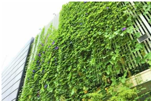
建築物の外壁面の緑化