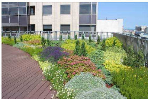
建築物の屋上又は屋根の緑化