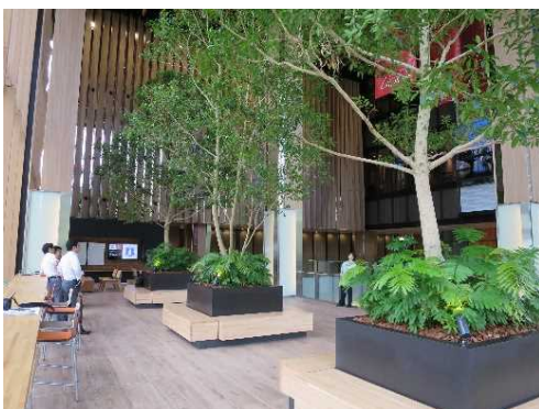
建築物内部の緑化