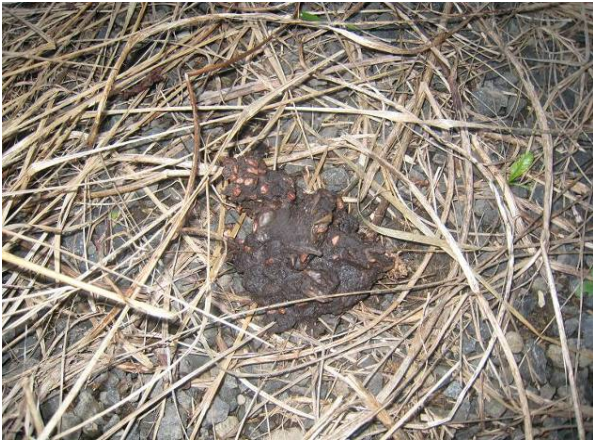
写真3 タヌキのフン