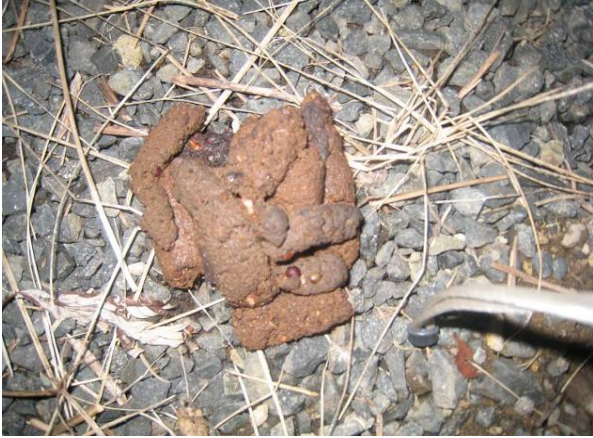
写真1 タヌキのフン