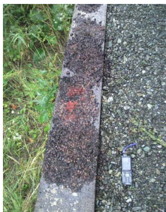
写真1 タヌキのフン