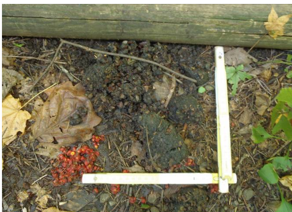
写真5 フン(内容物はクルミ、ブドウ)