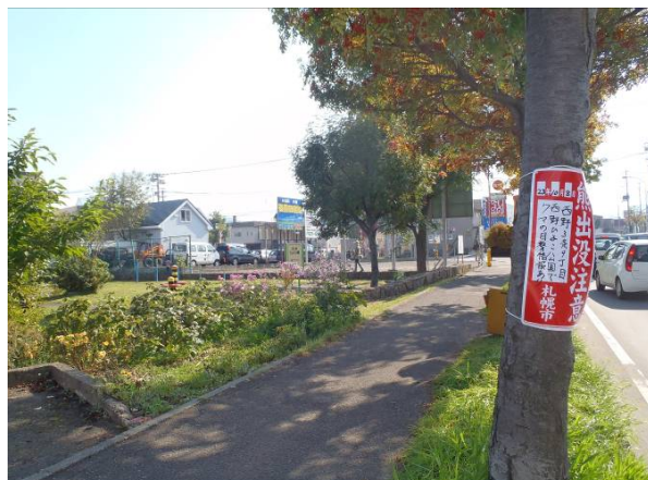
写真4 現場周辺環境