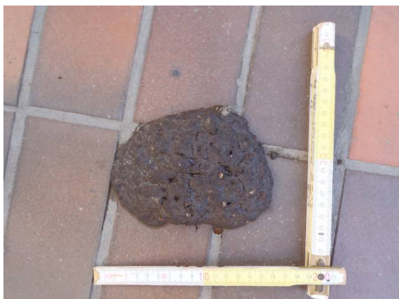
写真1 タヌキのフン