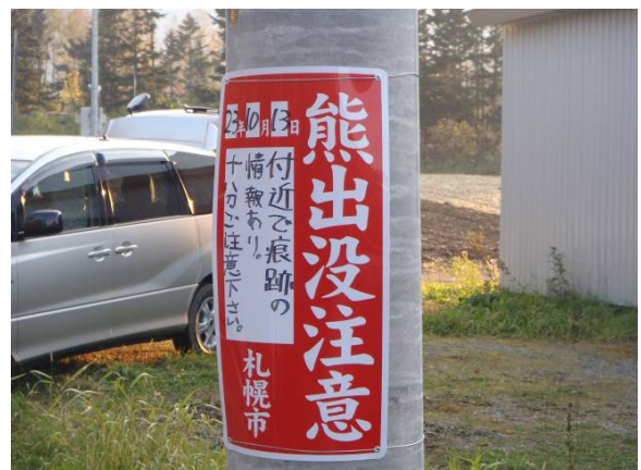
写真6 注意喚起看板