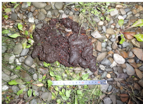
写真2 タヌキ等のフン