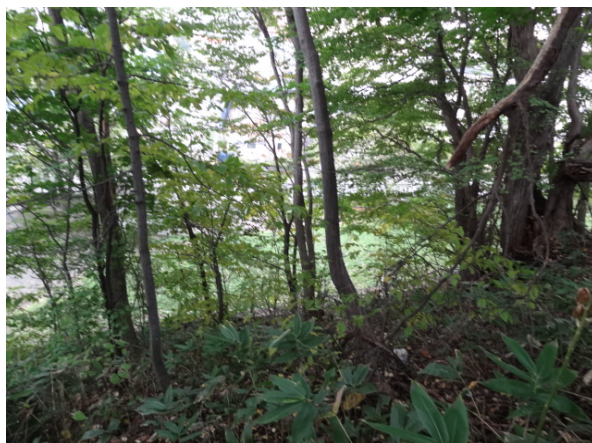
写真2 目撃地点周辺