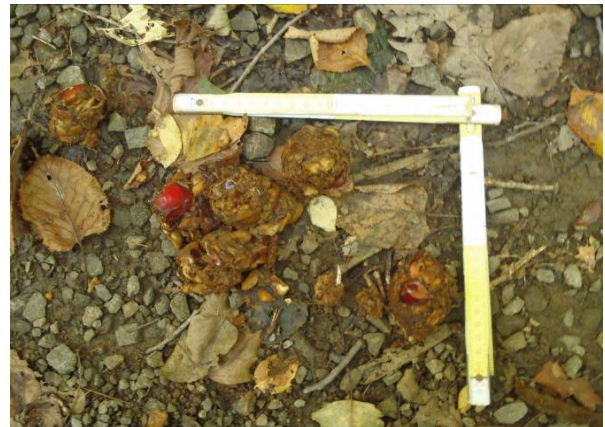
写真4 フン(内容物はリンゴ)