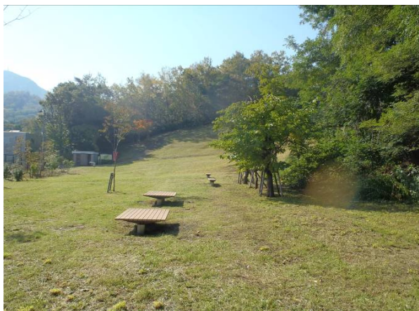
写真1 ちびっこ広場