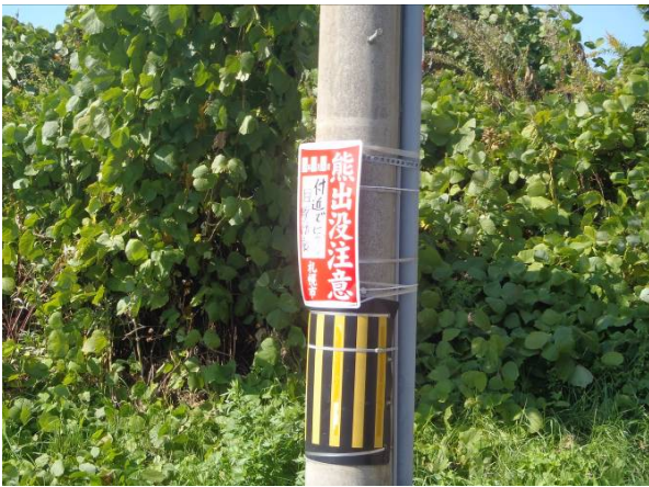
写真3 注意喚起看板設置状況