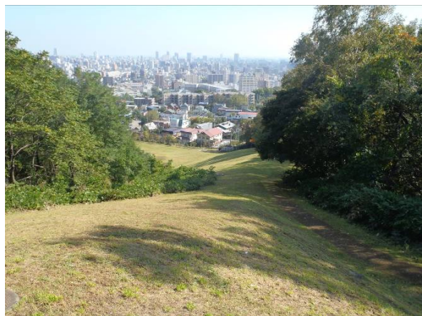
写真2 ちびっこ広場