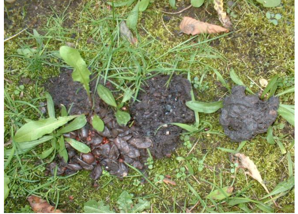
写真2 タヌキのフン