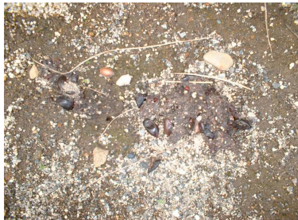
写真2 タヌキのフン