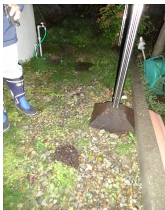
写真1 タヌキ等のフン