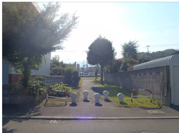
写真2 ひよこ公園入口