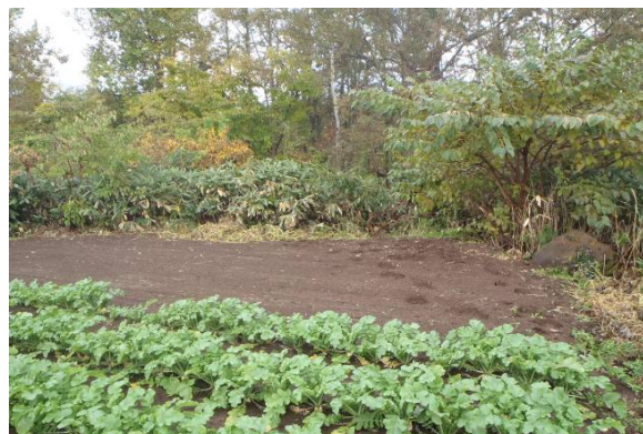
写真2 写真1の周辺写真