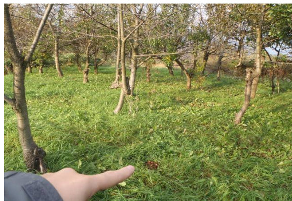
写真8 写真7の周辺写真