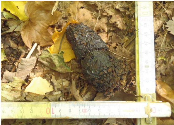
写真3 フン(内容物はクルミ)