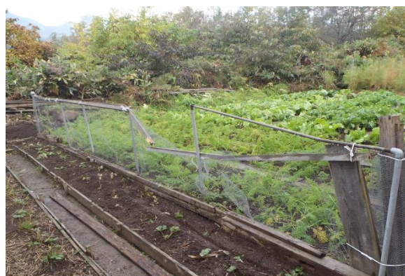
写真4 写真3の周辺写真