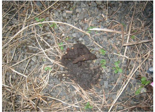
写真4 タヌキのフン