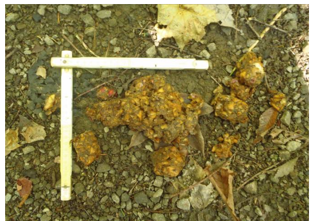
写真6 フン(内容物はリンゴ)