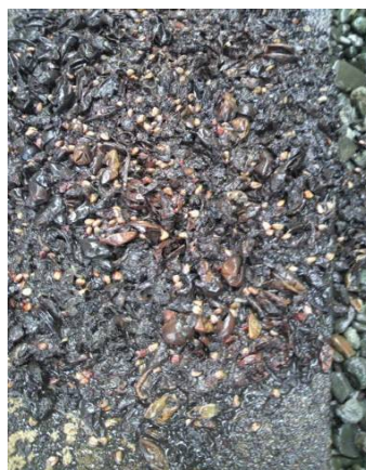
写真2 タヌキのフン