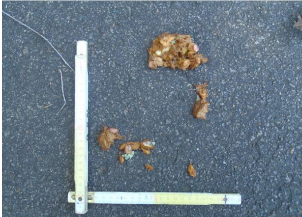
写真1 フン(内容物はリンゴ)