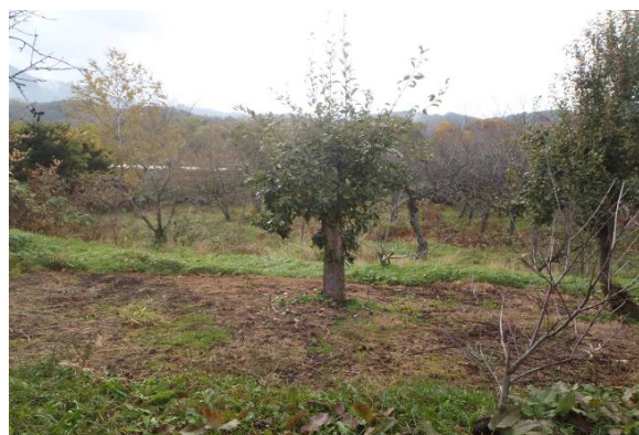
写真6 写真5の周辺写真