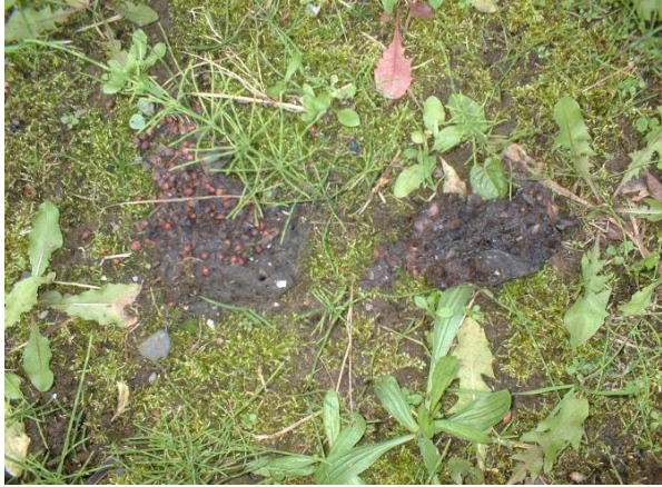
写真1 タヌキのフン