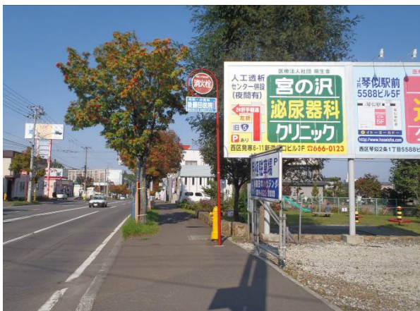
写真3 現場周辺環境