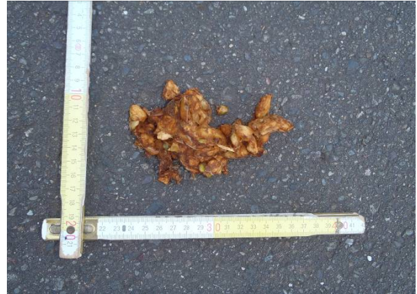
写真2 フン(内容物はリンゴ)