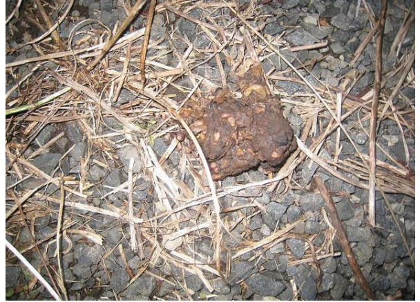
写真2 タヌキのフン