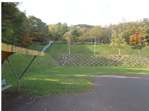
写真1 現場写真(奥方向が高台)