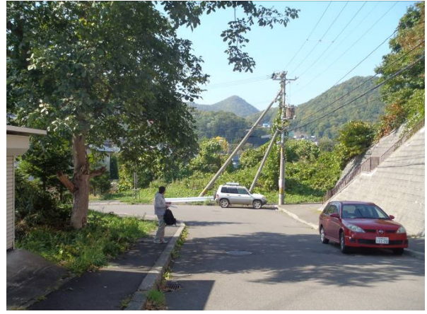
写真2 被毛採取地点(画像左の樹木)