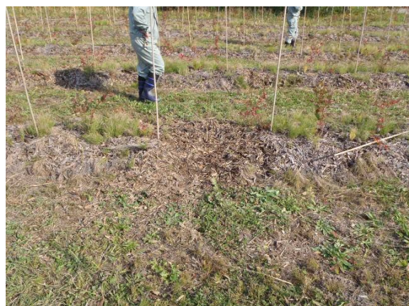
写真4 タヌキ掘り跡