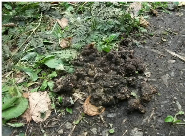
写真1 タヌキのフン