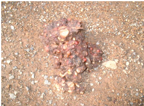
写真1 タヌキのフン