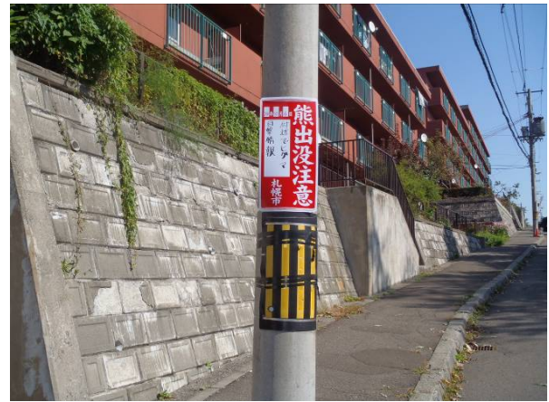
写真4 注意喚起看板設置状況