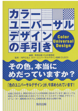
『カラーユニバーサルデザインの手引き』(書籍)

学校生活で、色弱の子もたちがどのような場面で困るのか、また、どのような改善方法があるのかなどを分かりやすく解説。学校関係者や色弱のお子さんを持つ親御さんにおすすめの1冊です。