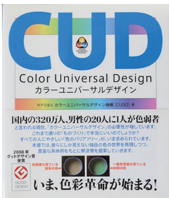
『カラーユニバーサルデザイン』(書籍)

色弱の当事者が書いた1冊。「一般色覚者は色弱を知る。色弱者は一般色覚を知る。その違いを認識し、お互いに理解しあうことは必要であるだけでなく、実はとても楽しいもの」ということを知っていただければと思います(略)あなたが相手を丸ごと理解しようと試みたとき、初めてその色覚も理解され、未来につながる道が拓かれるのだと私は信じます。(同書より)