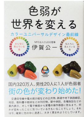
『色弱が世界を変える』(書籍)

誰にとっても判別しやすい配色を選ぶためのノウハウを、ケーススタディで解説。文字、目次やインデックス、地図や図形、グラフの彩色の実践例が分かりやすく掲載されています。