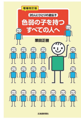
『増補改訂版 色弱の子を持つすべての人へ ~20人にひとりの遺伝子~』(書籍)

「あなたの情報は伝わっていますか?」色弱者の色の世界を再現しつつ、豊富な具体例をもとに解決策を提案。カラーユニバーサルデザインについてもう少し深く知りたい方におすすめの本です。