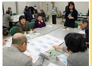
▲グループごとに検討する様子