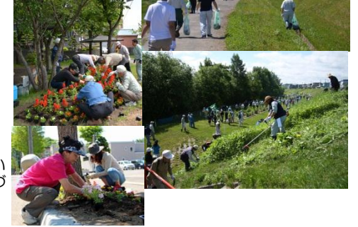
▶清田地区住みよい安心安全なまちづくり協議会 (清田緑地周辺)