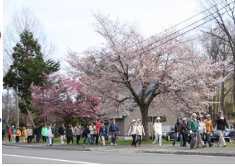
◀あしりべつ桜並木通り (旧国道36号) を歩く桜ウォーキング・花見会