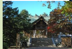
◀厚別神社 秋の風景