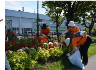
▲あしりべつ桜並木通りの花壇