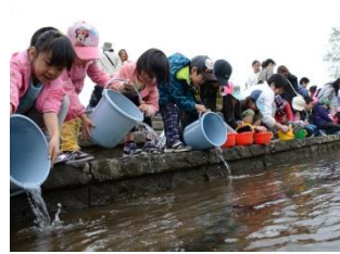
▲ヤマメの稚魚放流 (北野ふれあい橋付近) 北野地区町内会連合会 (北野地区青少年育成委員会)