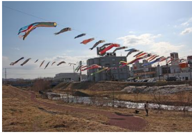
▲こいのぼりの掲揚 (清田橋付近) NPO 法人あしりべつ川の会