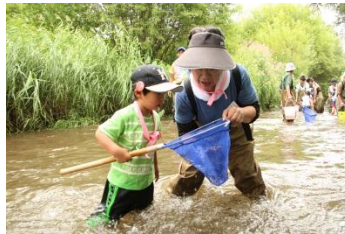
▲あしりべつ川体験塾 ・清田区地域振興課 (清田橋付近) ・協力: NPO 法人あしりべつ川の会、札幌国際大学、札幌市子ども会育成連合会清田支部 など