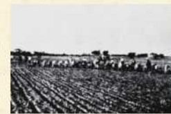
▲ 明治の頃の藍の移植作業の様子

現在も「興産社」の名は町内会の名称として残り、平成25年開校の「札幌英藍高校」では学校名と校章に「藍」が使われているなど、今も藍とその歴史は地域に根付いている。