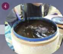
4 ①の灰汁と③を合わせて毎日混ぜる。