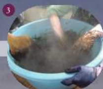
3 ②に①の灰汁を少量加えてよく練る。