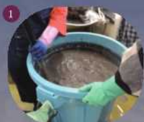
1 灰に熱湯を加えて灰汁(あく)を作る。