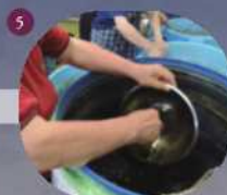
5 ふすま(小麦の外皮)や酒などを加え発酵を促進させる。