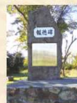
▲ 滝本五郎の報(頌)徳碑