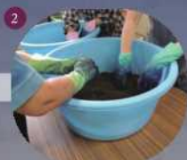
2 薬(すくも)を細かく砕く。