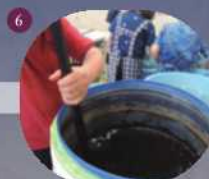
6 液の温度とアルカリ度を管理し、毎日混ぜる。