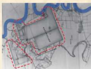
▲ 篠路村一帯で藍が栽培されていた頃の古地図

また、当時はニシン漁が盛んだため、作業員を引き抜かれ転職者が続出し、人手不足にも悩まされた。