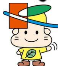
清田区マスコット キャラクター きよっち

市民の皆様には、日頃から市政に対し格別のご協力を賜り厚くお礼申し上げます。 札幌市では、地域交流拠点清田（裏面参照）の今後の取組として、清田区総合庁舎（区役所、消防署、図書館）周辺における恒常的なにぎわいや交流の創出に向けた効果的な手法を検討しているところです。