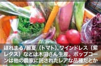
表紙：とれたす。で扱う野菜たち

ほれまる/麗夏 (トマト)、ワインドレス (紫レタス) などは木田さん生産。ポップコーンは他の農家に託されたレアな品種だとか