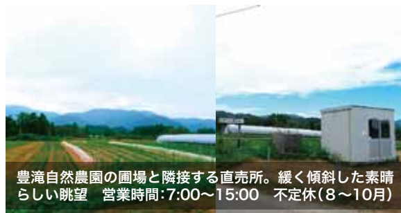
豊滝自然農園の圃場と隣接する直売所。緩く傾斜した素晴らしい眺望 営業時間：7:00～15:00 不定休(8～10月)