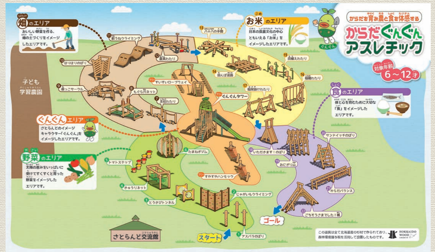
アスレチック遊具広場のイメージ