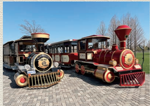
左) ポテト号(2代目)、右) オニオン号

4月29日、新たなSLバスがさとらんどに仲間入りしました。その名も『オニオン号』。鮮やかな赤色に東区の名産たまねぎをイメージした金色が映える、オシャレなデザインです。