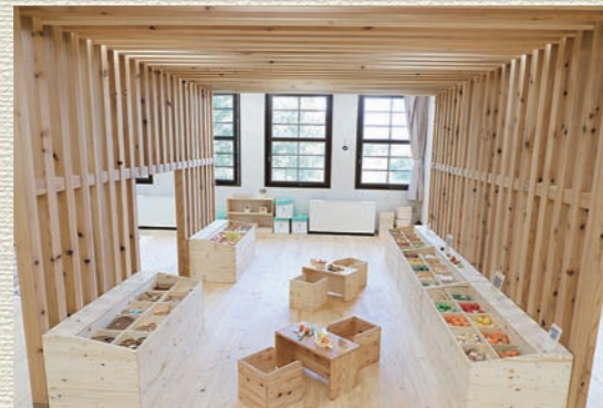
さとらんどマルシェ