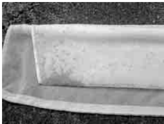
捕獲したハモグリバエ