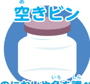
みず におい や いろ 水においや色を調べる