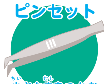
小さな むし 小さな虫をつかむ