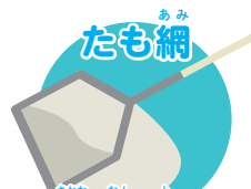
さかな むし と 魚、虫を取る