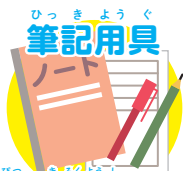
えんぴつ 鉛筆、記録用紙、ノート