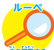
むし かんさつ 虫を観察する