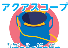
すいちゆう の 生きもの 水中の生き物を探す