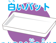
つかまえた むし つかまえた虫を分ける