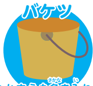
つかまえた さかな つかまえた魚を入れる