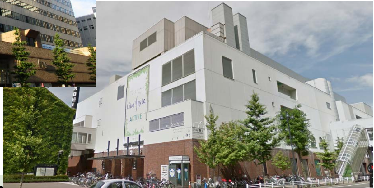
▶ 中央市税事務所 (サッポロファクトリー2条館 4階)