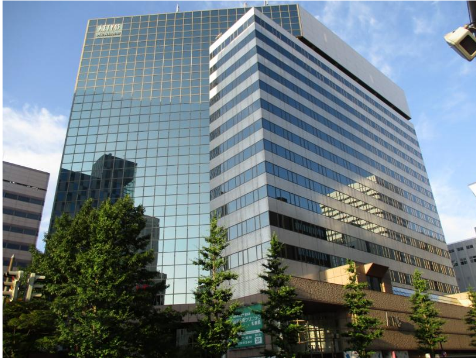
▶ 北部市税事務所 (アスティ45 9階)