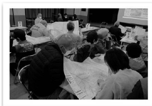
各地区防災訓練・研修会（風水害24）