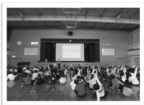
小学生を対象とした雪体験授業