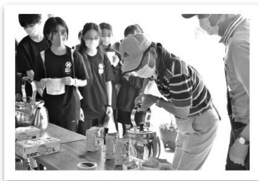
東区防災訓練（給食給水訓練）