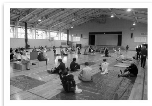
各地区防災訓練・研修会（避難所開設訓練）