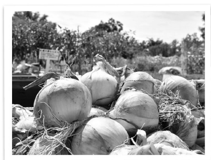
東区名産のタマネギ