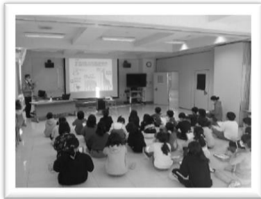
小学生を対象とした雪体験授業