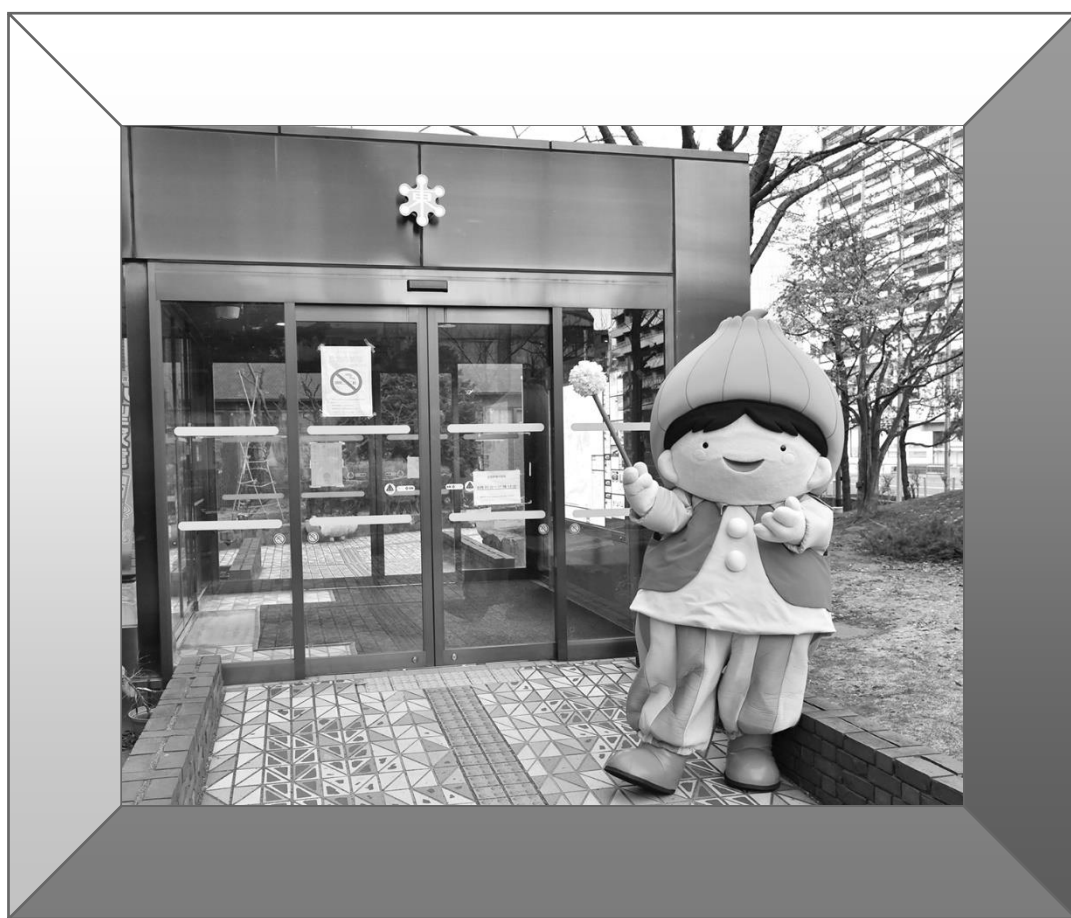
東区役所正面入口