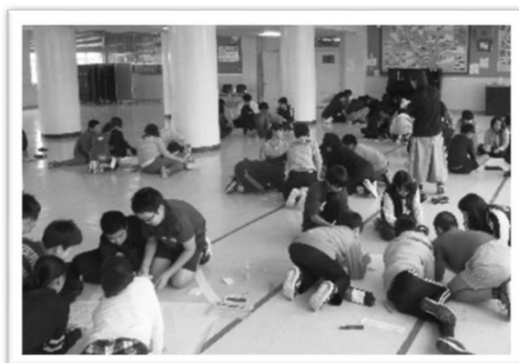
伏古小学校での 子どもDIG