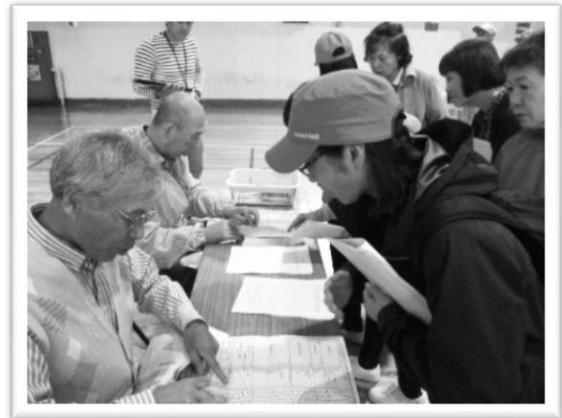
防災研修会（避難所開設・受付訓練の様子）