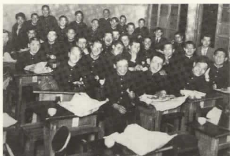
昭和10年ころの生徒（札幌西高「創立70周年・定時制60周年記念誌」から）

向学心に燃える若者たちは、必死に働き家計を支えながら、学間に励みました。その中から、困難に遭っても挫折せず、粘り強く初志を貫く精神「夜学魂」が