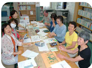
↑図書貸出しボランティアのみなさん