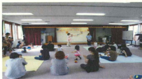
<ほのぼの子育てルーム>