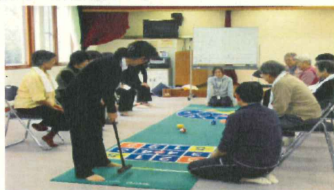
<シルバー健康教室>

曙会館では、介護予防センターによる「すこやか倶楽部」や「シルバー健康教室」等、高齢者のみなさん（65歳以上）向けのプログラムや、就学前のお子さんとそのお母さんが楽しく遊べる「曙ほのぼの子育てルーム」など、さまざまな活動が行われています。ご興味のある方は、ぜひ一度お越しください！