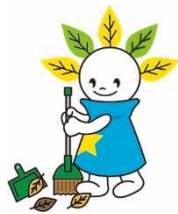
厚別区マスコットキャラクター 「ピカットくん」