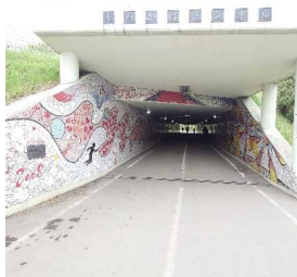
＜しらかばトンネル＞

地域住民、近隣の大学や小学校などの皆さんが協力して制作したモザイクタイルアートがあります。