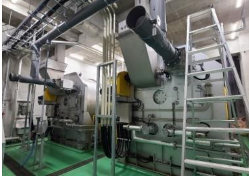
ゾウのファンをひ料にするための施設を作りました (2億9195万円)