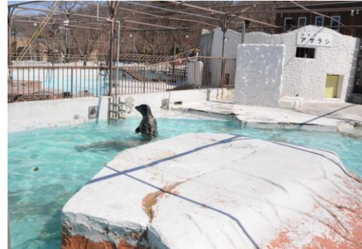
もともとアザラシがいた海獣舎などを解体しました(7635万円)