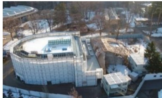
古くなったオランウータンの施設を建て直しています。 2022年度までの合計：3億4543万円 ※さらに2023年度の完成までに8億5920万円