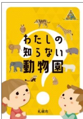
パンフレット 「私の知らない動物園」