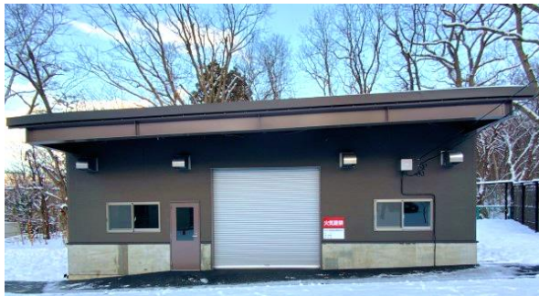
草食動物のエサを置く小屋を新しく建てました (3970万円)