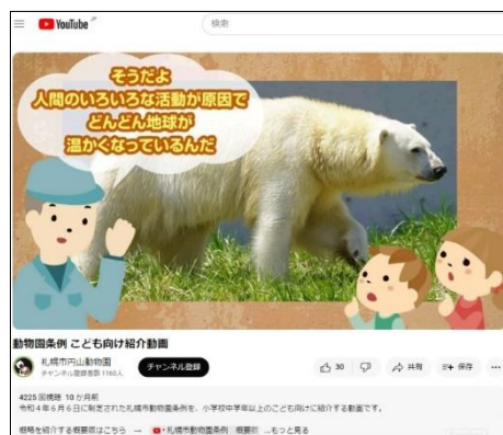
公式YouTube 「動物園条例 こども向け紹介動画」