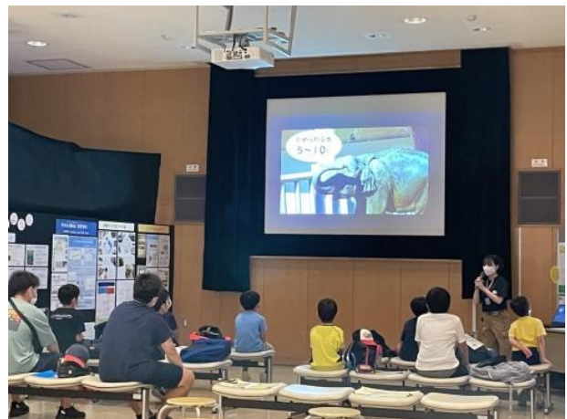
学校向けにガイドを行っています