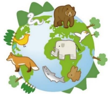
「生物多様性さっぽろ実践ハンドブック」から転載