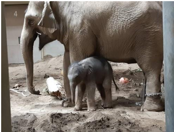
希少な動物の繁殖に取り組んでいます