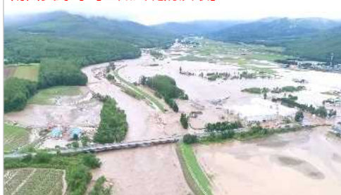
南富良野町【空知川堤防決壊】