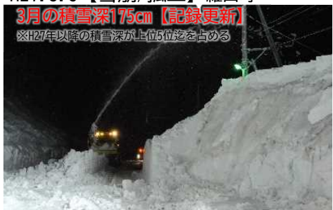
3月の積雪深175cm【記録更新】 ※H27年以降の積雪深が上位5位を占める