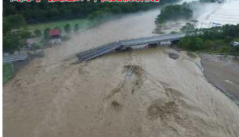
目高町【国道274千呂露橋落橋】