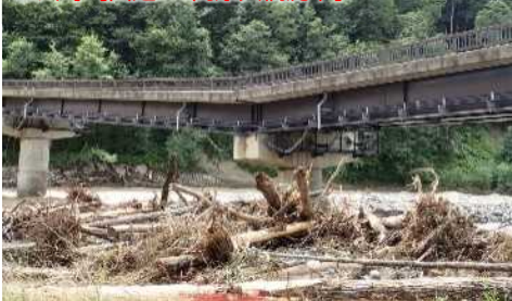
上川町【国道273高原大橋沈下】