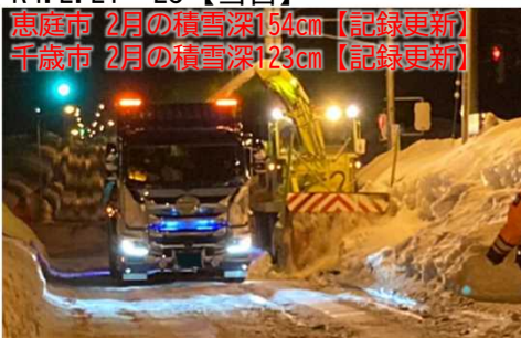
恵庭市 2月の積雪深154cm【記録更新】 千歳市 2月の積雪深123cm【記録更新】