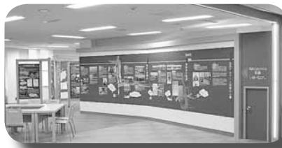
▲札幌のまちの成り立ちや空港の歩みを展示した「札幌いま・むかし探検ひろば」

当日は、増毛からの直送品を販売する「産直市」(午前11時30分～)や、フラダンスショー(午後1時～)なども行われます。この機会にぜひ、丘珠空港へ足を運んでみませんか?