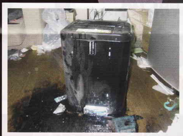
こぼれた灯油に気づかず ストーブに点火すると…