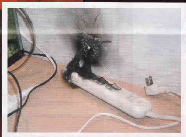
普段、目につかない コンセントまわりから…