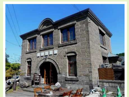
ほすとかんく(旧石山郵便局) 1940年築