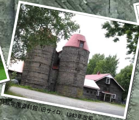
八紘学園資料館(旧サイロ) 1943年改築