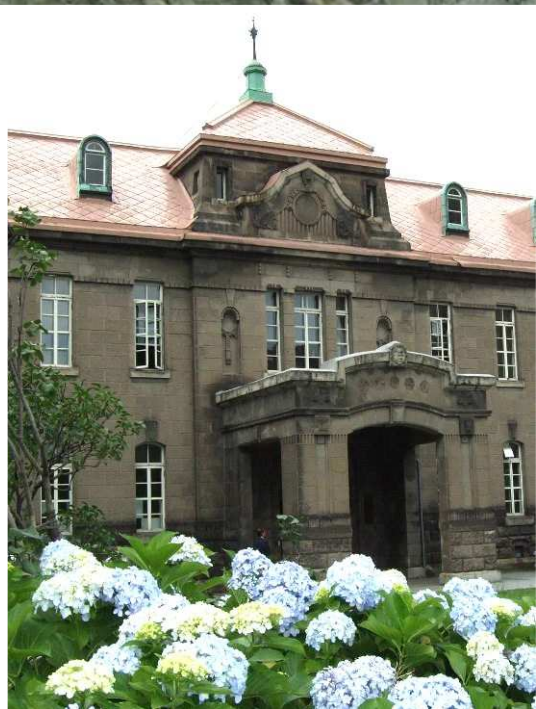
札幌市資料館(旧札幌控訴院) 1926年築

開場時間 ▶ 平日 8:45 - 20:00 ※ただし図書館休館日は17:00まで 土曜日・日曜日 8:45 - 17:00