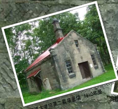
北海道大学旧第二農場金場 1910年築