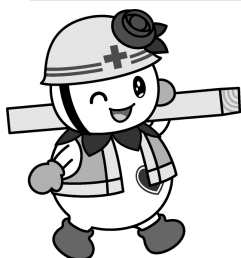
白石区マスコットキャラクター しろっぴー