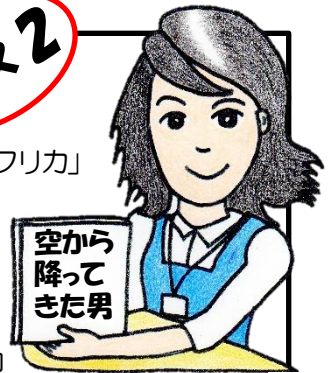
図書館司書ツボッティ

日本からとっても遠い大陸「アフリカ」 地理的にも文化的にも情動的にも遠くて、テレビやネットで見る事が多いかな。