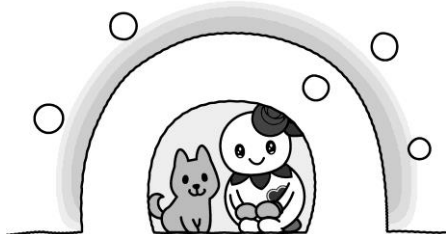
白石区マスコットキャラクター しろっぴー

例年にくらべて雪が少ない分、過ごしやすい冬と言えるかもしれませんが、道民としてはちょっと寂しい気もします。とはいえ、まだまだ寒い日は続きます。暖かくして読書を楽しんでください。