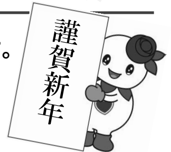
白石区マスコットキャラクター しろっぴー