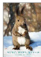
さっぽろ絵本グランプリ受賞作も、いつでも読めます。

北海道に関する本や北海道出身作家の本などは「郷土資料」として蔵書しています。実は郷土資料は順番待ちをせずに読める「読み放題」の本が多く、いつでも好きなときに読むことができます。