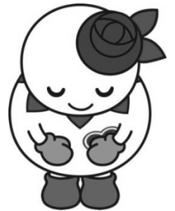
白石区マスコットキャラクター しろっぴー

※期間中の本の返却は返却ポストをご利用ください。また、CD等の視聴覚資料は返却ポストには入れず、他の図書館・図書室のカウンターへ返却願います。