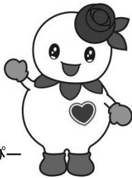
白石区マスコットキャラクター しろっぴー