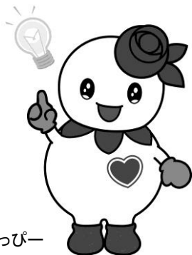
白石区マスコットキャラクター しろっぴー

※1・2共に出典は「データブック オブ・ザ・ワールド Vol.31 (2019) 世界各国要覧と最新統計」。東札幌図書館の蔵書です。貸出禁止ですが、図書館内では自由に閲覧可能です。