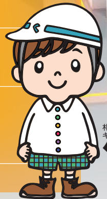
札幌市区画整理 キャラクター くかくん