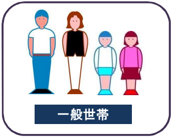
夫婦+子供2人の場合