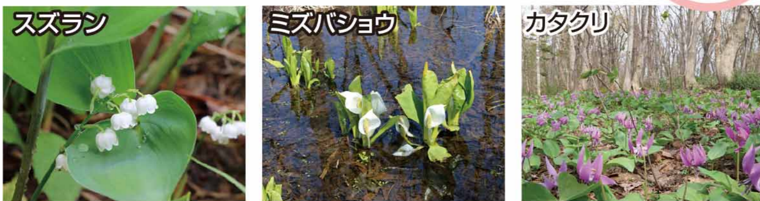
富丘西公園 MAP E-4 星置緑地 MAP B-4 稲穂ひだまり公園 MAP D-4

富丘西公園には市内最大規模のスズランの群生地、星置緑地には市内最大規模のミスバショウの自生地があります。稲穂ひだまり公園では市内でも珍しいカタクリの群生を見ることができます。