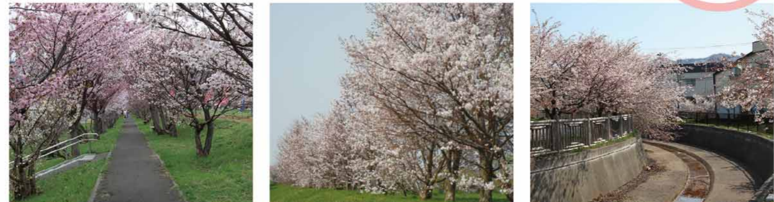
軽川緑地 MAP D-3, E-2, E-3 たくさんの桜が植えられています。 中の川緑地 MAP F-4 約4kmの桜並木が続いています。 旧軽川緑地 MAP D-2 住宅街にありながら桜並木を楽しめます。