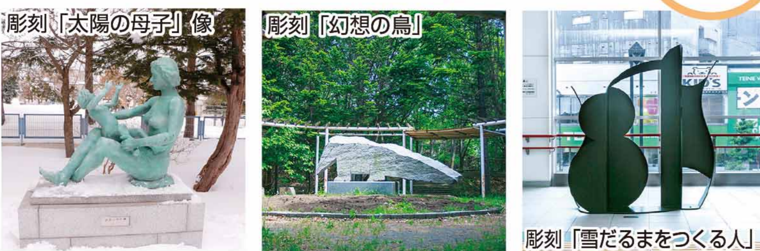
手稲コミュニティセンター (作:本郷 新氏) 前田森林公園 (作:ピエール・セカリー氏) JR手稲駅自由通路「あいくる」 (作:國松 明白香氏)