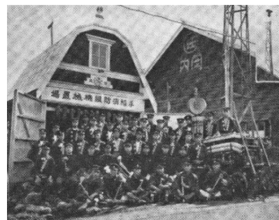
『あゆみ』に掲載された手稲消防組

死を覚悟したことも二度三度、終始緊張して過ごされた数十年におよぶ団員生活であった。歴史を振り返り、改めて私たちは、地域のためにボランティアとして立ち上がったこれらの方々に衷心よりの謝意を述べねばならない。