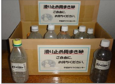
砂入りペットボトル

ツルツルになった道路への砂まきにご協力をお願いします。 手稲コミュニティセンター入口に、持ち運びに便利な『滑り止め用の砂を入れたペットボトル』や『砂袋(3kg)』を設置しています。どうぞご活用ください。 (12/29～1/3は、手稲コミュニティセンター休館日)