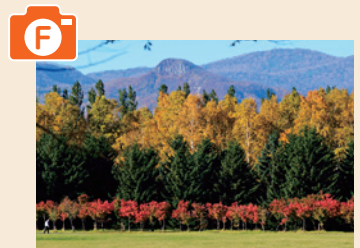
F サクラとシラカバ