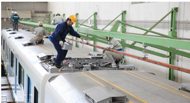
車体屋上整備(パンタグラフ)