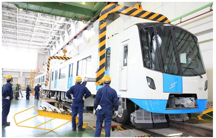
車体・台車組み付け