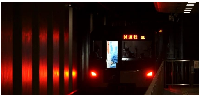
車両走行性能試験中