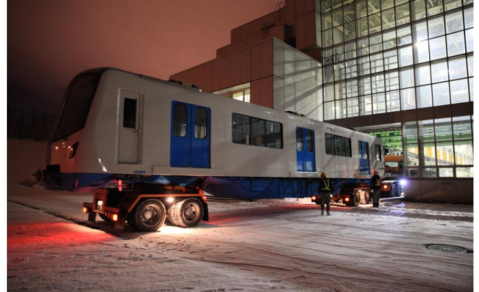
トレーラーで東車両基地へ搬入