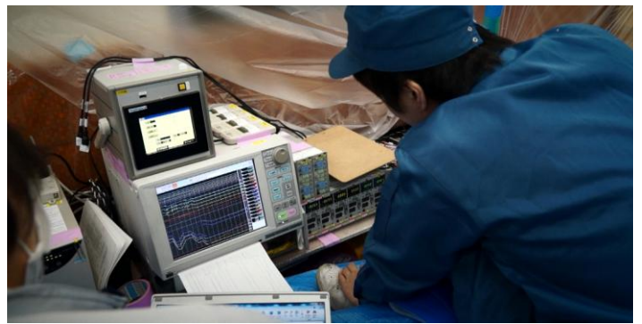
車両走行性能試験中