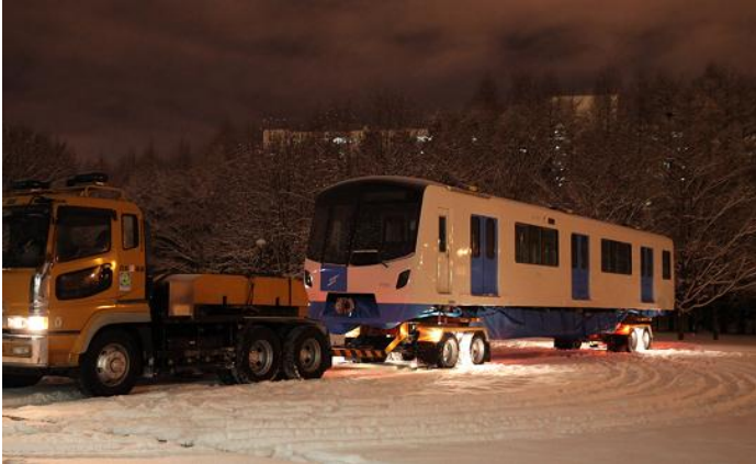
トレーラーで東車両基地へ搬入

運転開始までに行ってきた車両基地への車両搬入の様子や、実際の路線を使用した走行試験の様子を掲載いたします。