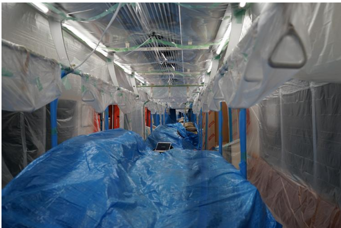
車両走行性能試験中(満車試験)