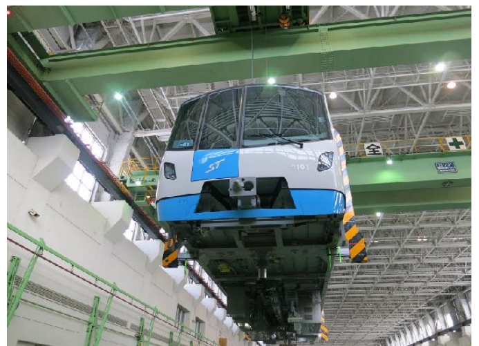
車体・台車組み付け