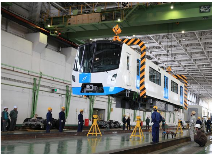
床下機器等確認準備