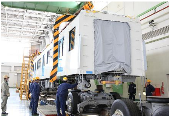
車体・台車組み付け