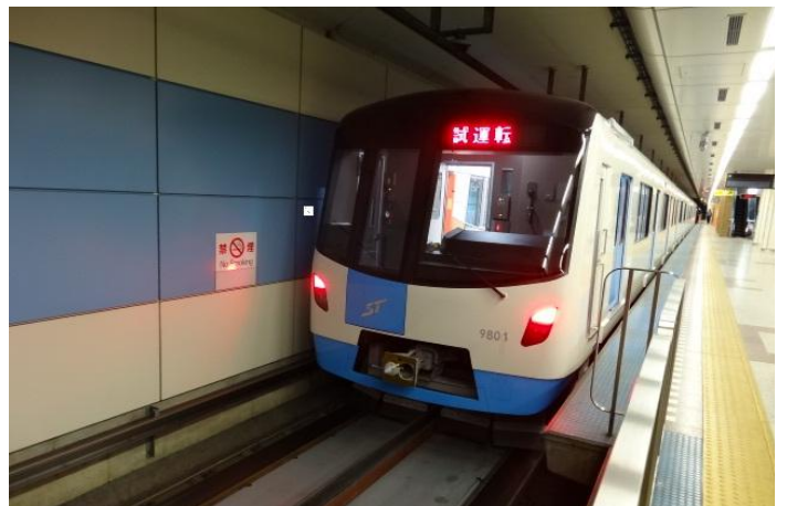
車両走行性能試験中