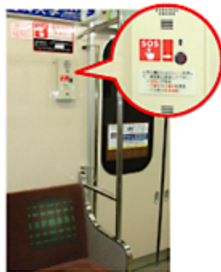
非常通報ボタン車内配置図

ひじょう つうほう 非常通報ボタン を 1車両に3カ所設置 しています(下図)。 このボタンを押すと、 運転手と直接通話 することができます。 ※運転手が応答できない場合 には、運行管理を行う職員が 応答します。