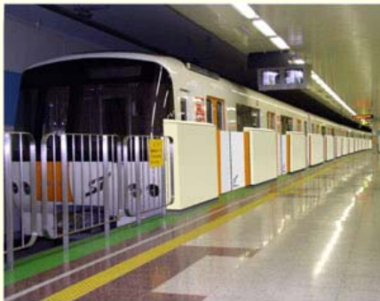
〈可動式ホーム柵イメージ〉

南郷7丁目駅中線ホームには先行して設置し、訓練等を行った後使用を開始する予定です。