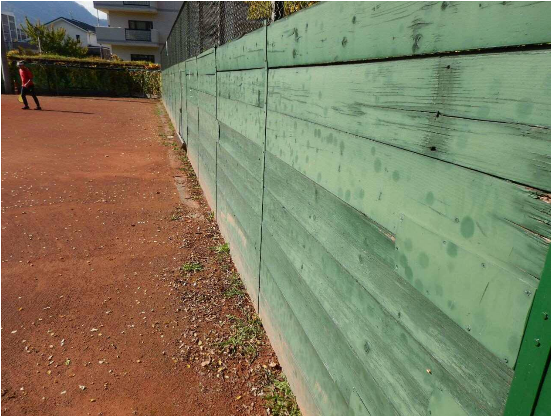
フェンス コート外側