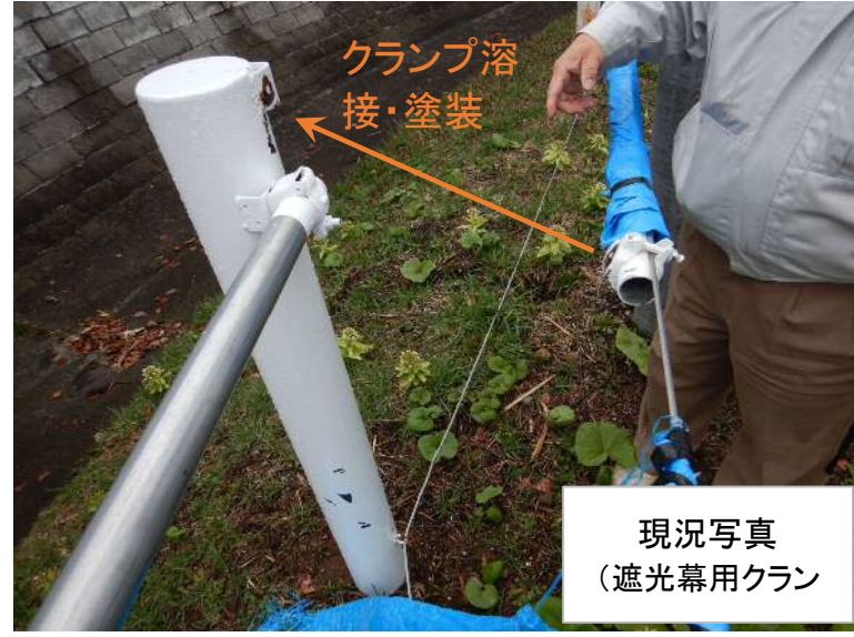
現況写真 (遮光幕用クラン)