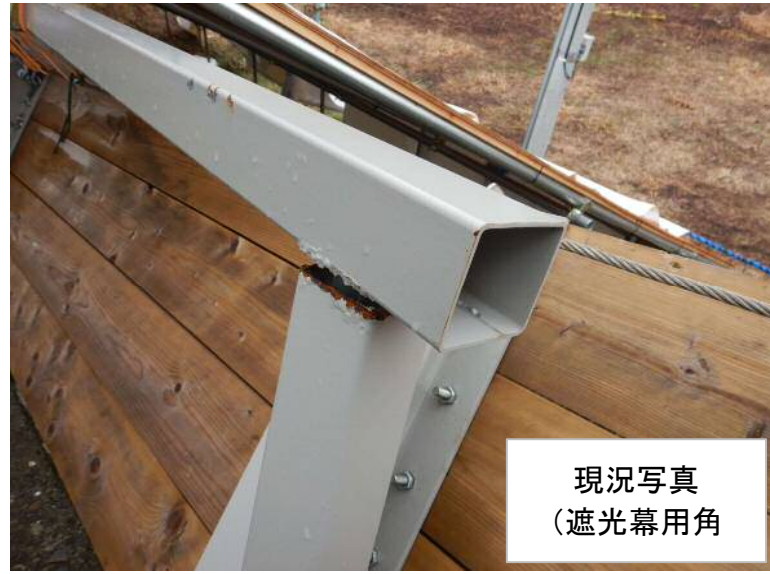
現況写真 (遮光幕用角)