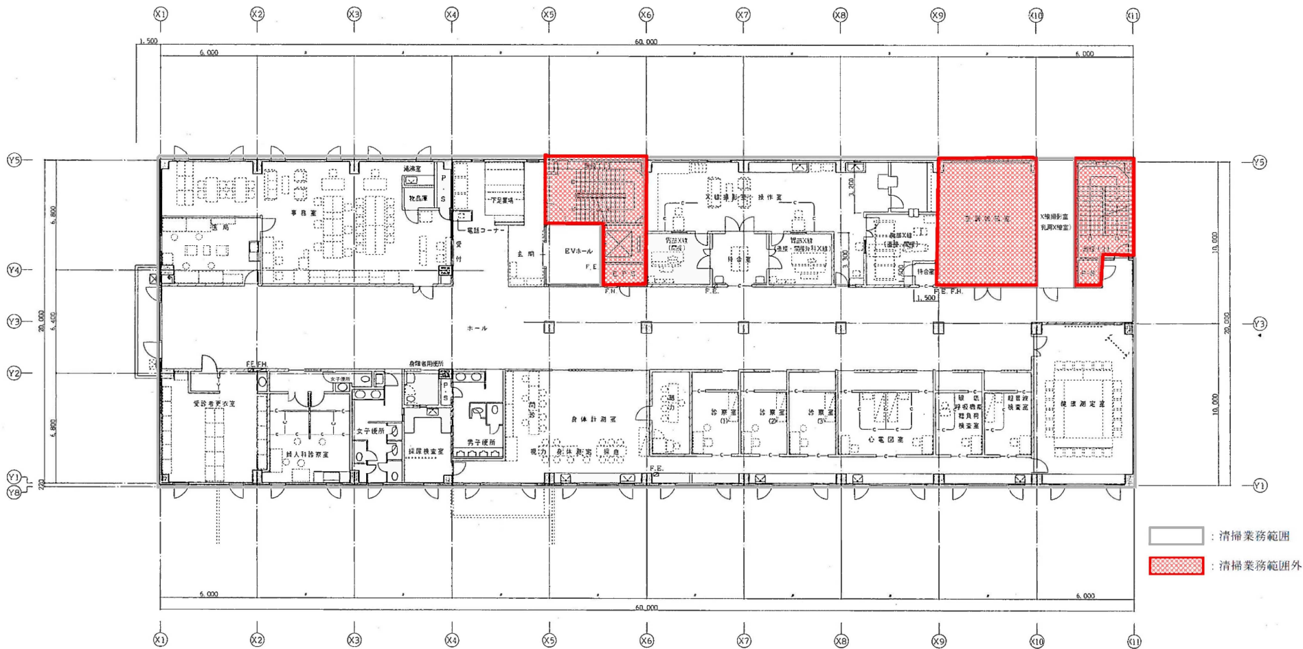
リフレッサポロ（厚生棟） 3階平面図 <概略図>