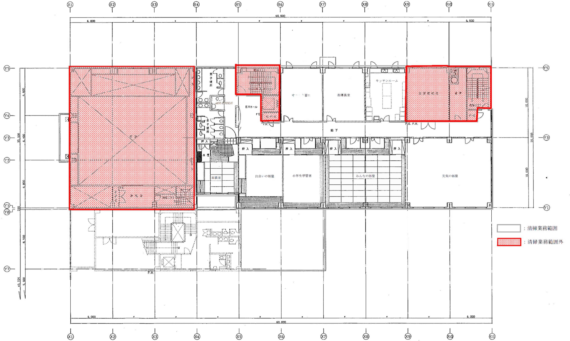
リフレサッポロ（厚生棟） 2階平面図 <概略図>