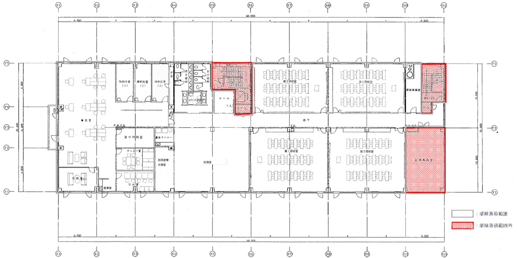
リフレサッポロ (厚生棟) 5階平面図 <概略図>