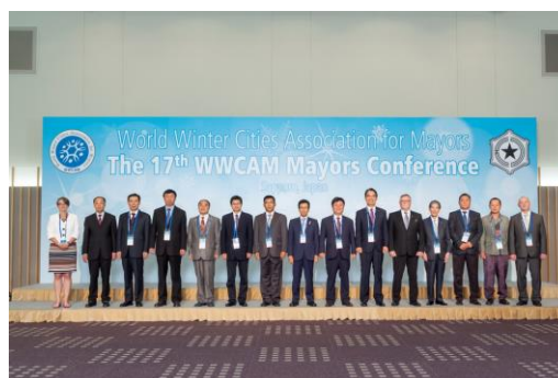
17 конференция мэров северных городов (июль 2016 г., Саппоро, Япония)

Место проведения конференции выбирается из ряда баллотировавшихся городов-участников на общем заседании, местом проведения 17-й конференции утвержден г. Саппоро, Япония.