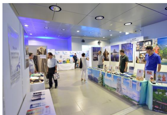
Зимняя выставка (июль 2016 г., Саппоро, Япония)