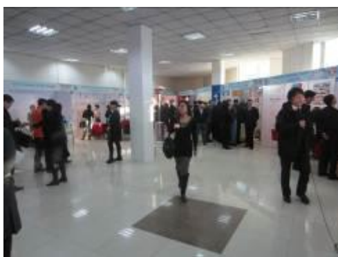
Зимняя выставка (январь 2012 г., Улан-Батор, Монголия)

Город, где проводится конференция мэров, вправе организовать Зимнюю выставку как сопутствующее конференции мероприятие. На этой выставке, играющей важную роль в развитии экономических связей между зимними городами, фирмы и организации городов-участников экспонируют оборудование и товары, связанные с зимой и снегом, а также знакомят с различными технологиями.