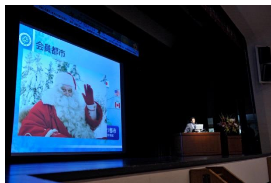
Форум зимних городов (июль 2016 г., Саппоро, Япония)

Город, где проводится конференции мэров, вправе организовать Форум зимних городов как сопутствующее конференции мероприятие. В ходе этого форума специалисты и учёные из различных областей науки либо жители городов выступают с докладами о зимнем образе жизни и обустройстве города, а также обмениваются мнениями с участниками.