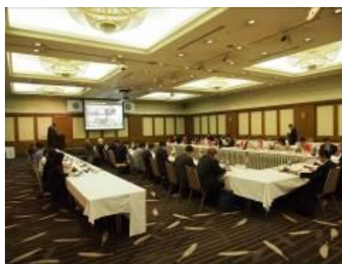
Рабочая встреча в 2015 г. (июль 2015 г., Саппоро, Япония)

Встречи проходят раз в 2 года в городе, где размещён секретариат Ассоциации. В ходе рабочей встречи разрабатывают проект плана проведения следующей конференции мэров и ее повестку дня, а также обсуждают вопросы управления Ассоциацией мэров.