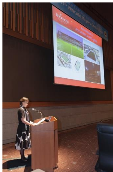
Комитета по арктическому дизайну (июль 2016 г., Конференция мэров в Саппоро)