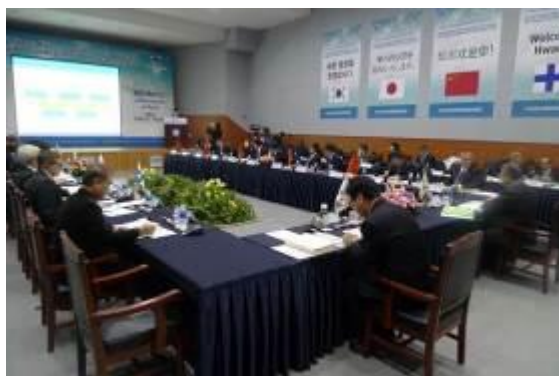
Комитет по сохранению окружающей среды (январь 2014 г., Конференция мэров в Хвачхоне)