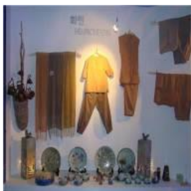
Выставка традиционных предметов одежды и предметов народного творчества